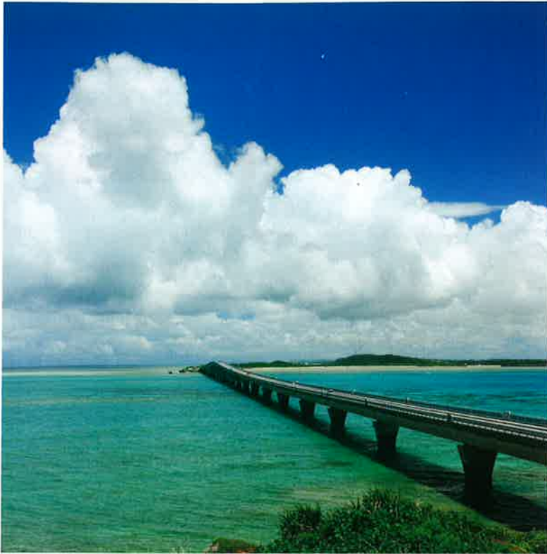
沖縄県宮古島市の池間大橋