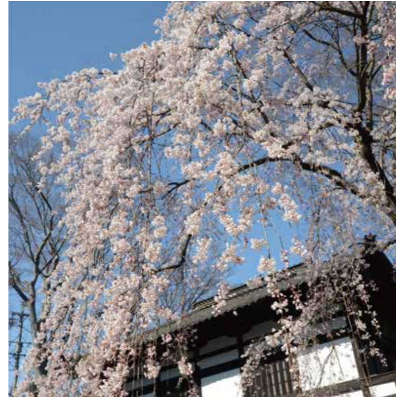
懐古園 三の門を彩るソメイヨシノ（長野県小諸市）。例年4月中旬に見頃を迎える